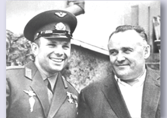
Главный конструктор и первый космонавт

Фотопортрет Олега Ивановича есть в экспозиции выставки, которая проходит в фойе второго корпуса